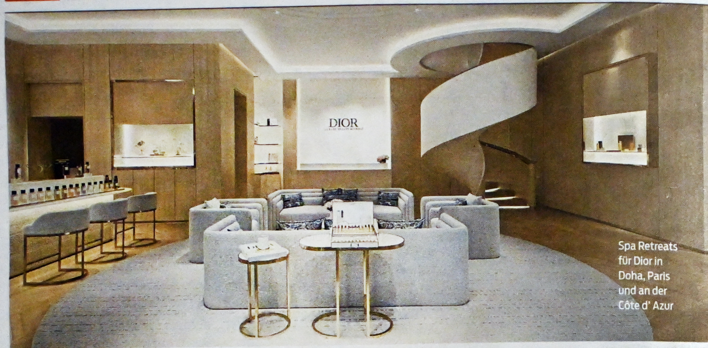
Spa Retreats für Dior in Doha, Paris und an der Côte d'Azur